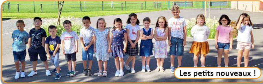
Les petits nouveaux !

Une belle tradition qui soulage les cœurs serrés lors de ce premier jour où ils font leur entrée à l'école élémentaire.