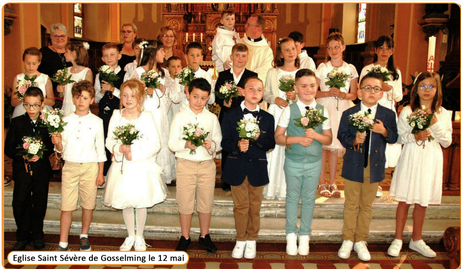
Eglise Saint Sévère de Gosselming le 12 mai