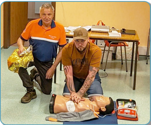
2ème session du 3 juin avec un groupe de jeunes retraités dynamiques de Gosselming et des environs. (photo ci-contre)